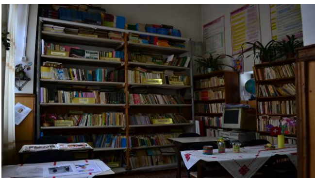
BIBLIOTECA SCOLII CU UN NR. DE 10.616 DE VOLUME