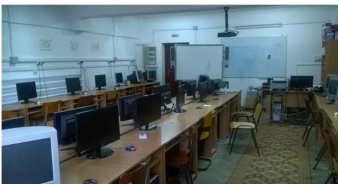
LABORATORUL DE INFORMATICA

Cadre didactice care vor conduce colectivele de elevi din clasele pregătitoare în anul școlar 2018- 2019: