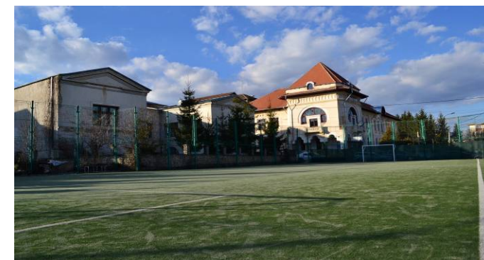
TERENUL DE SPORT