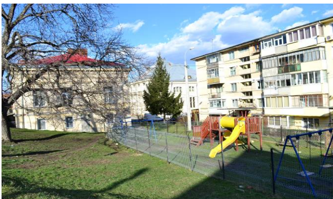
TERENUL DE JOACA AL GRADINITEI