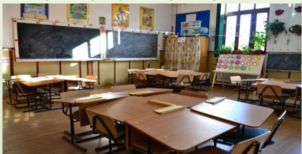
SALA CLASA PREGATITOARE