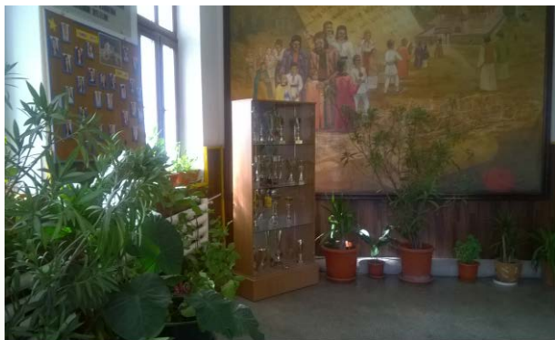
SALA CLASA PREGATITOARE