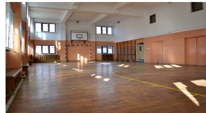
SALA DE SPORT