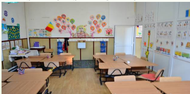
SALA CLASA PREGATITOARE